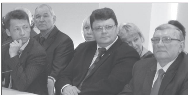
«СЛУЖЕНИЕ НОВОМУ ПОКОЛЕНИЮ»