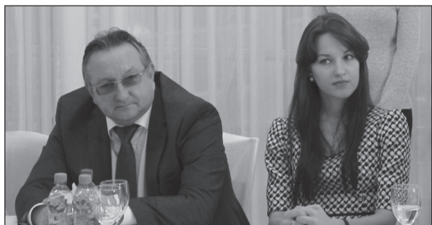
«НАМ ДОВЕРЯЮТ, СТАРШИЕ КОЛЛЕГИ»